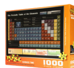
四等獎 元素表拼圖