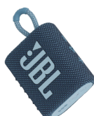
三等獎 JBL迷你藍牙喇叭