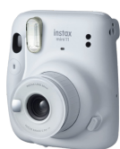
二等獎 拍立得相機